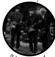
It Might Get Loud

PÅ DET FJERDE skal det skje: DNF viser seg fra sin sprekeste, mest tettpakke side i dag.