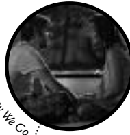
Away We Go

USA 2008 REGI Davis Guggenheim SPILLETID 1 t. 37 min. DISTR Tour de Force I et nedlagt varehus møtes tre gitarikoner: Jimmy Page (The Yardbirds, Led Zeppelin), The Edge (U2) og Jack White (The White Stripes, The Raconteurs). De jammer og snakker og hyller den elektriske gitaren som instrument, uttryksform og inspirasjonskilde. Regissør Davis Guggenheim følger også hver enkelt historie, illustrert av overraskende arkivmateriale. Her er Jimmy Pages første TV-opptreden som 13-åring og et ungt U2 i New Wave-habitt. Men først og fremst er It Might Get Loud en frisk rock doc med stor underholdningsverdi som elegant unngår nerde-fella.