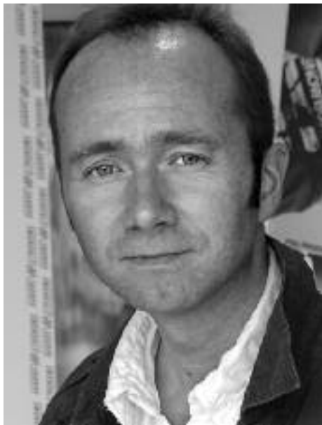
Norwegian culture minister Trind Giske – "we're getting there"