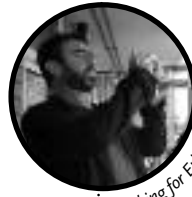
Looking for Eric