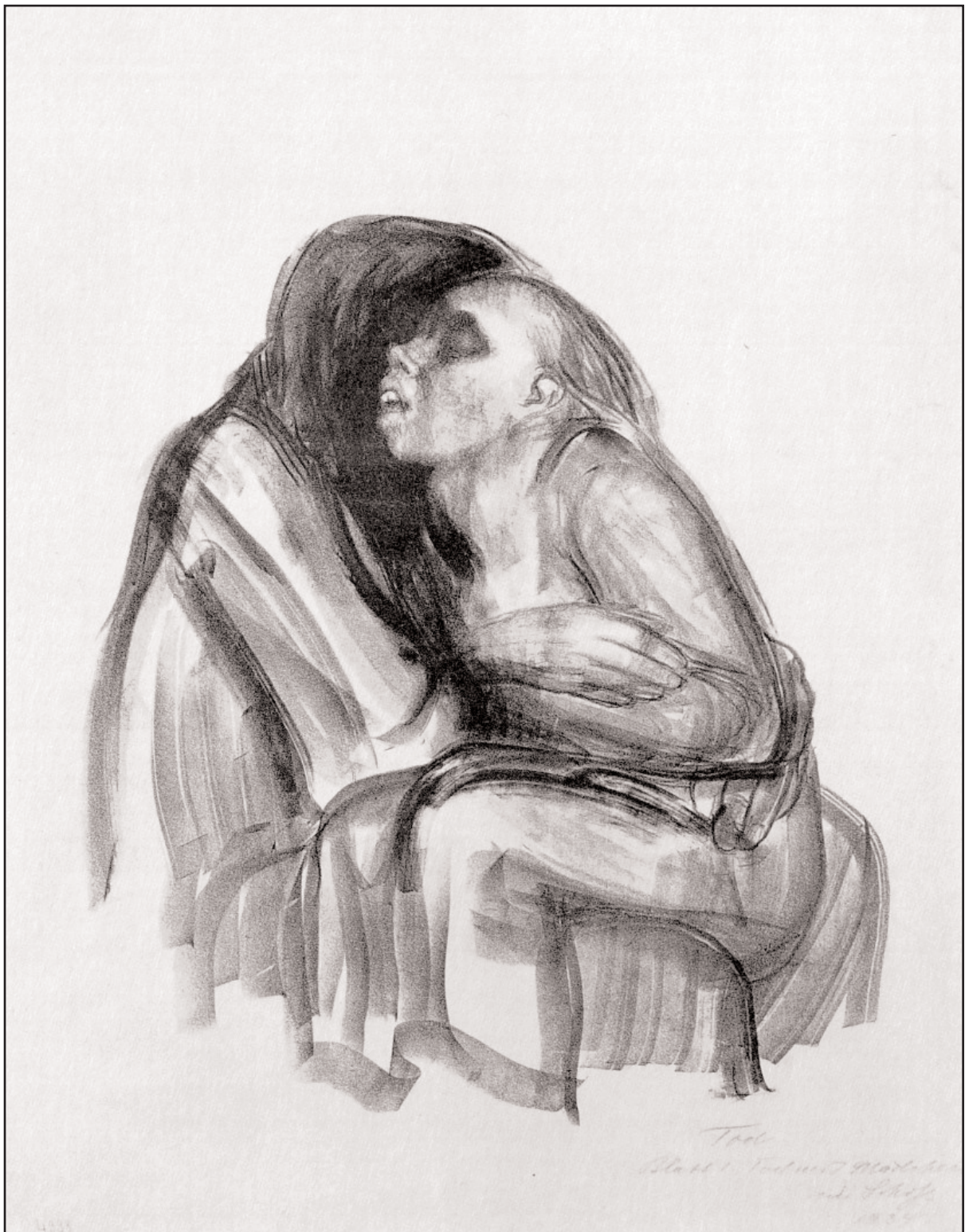
Døden holder jente på fanget; av Käthe Kollwitz